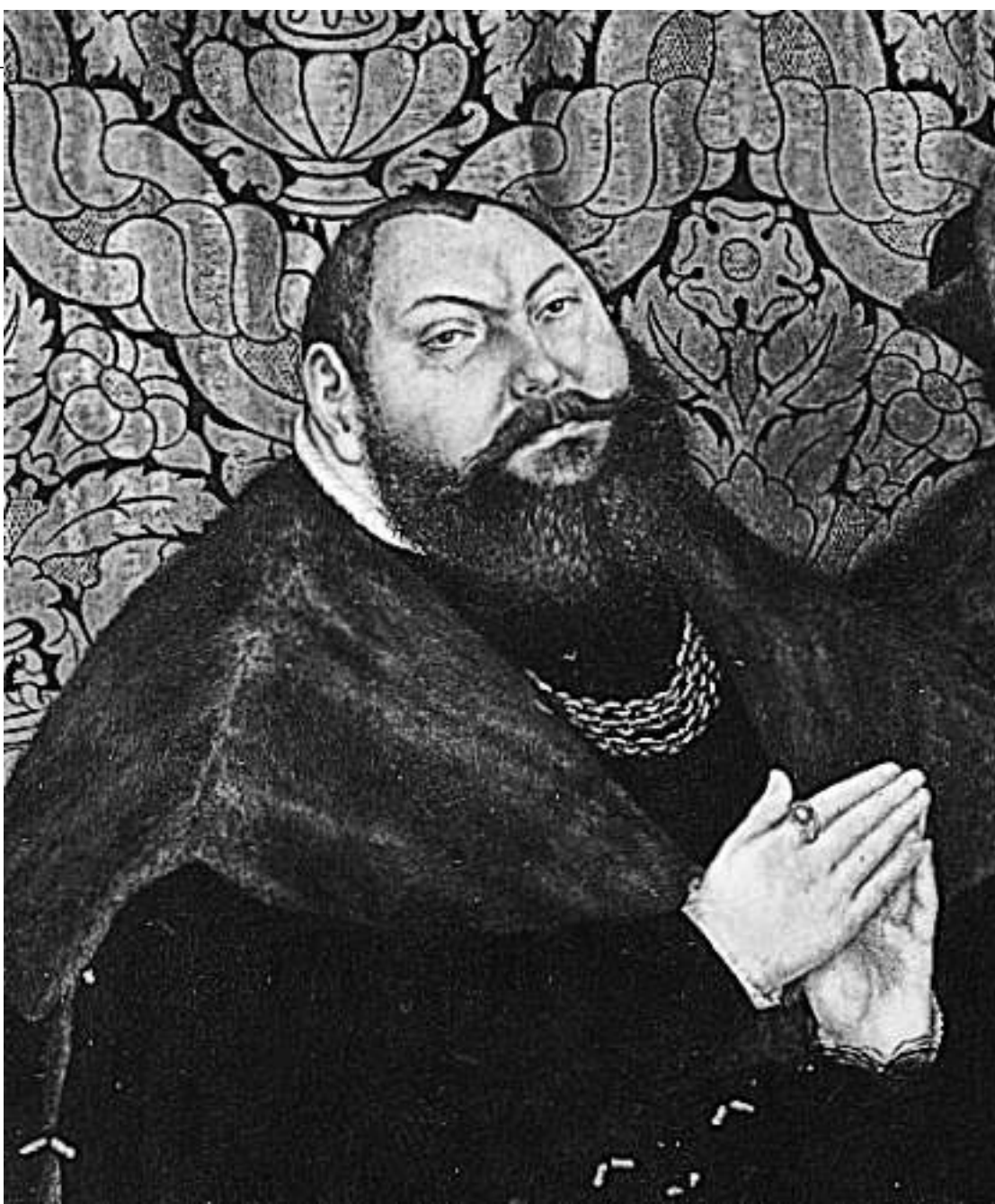
Der sächsische Kurfürst Johann Friedrich der Großmütige (1503–1554) auf dem linken Seitenflügel des Triptychons von Lucas Cranach in der Stadtkirche St. Peter und Paul zu Weimar.