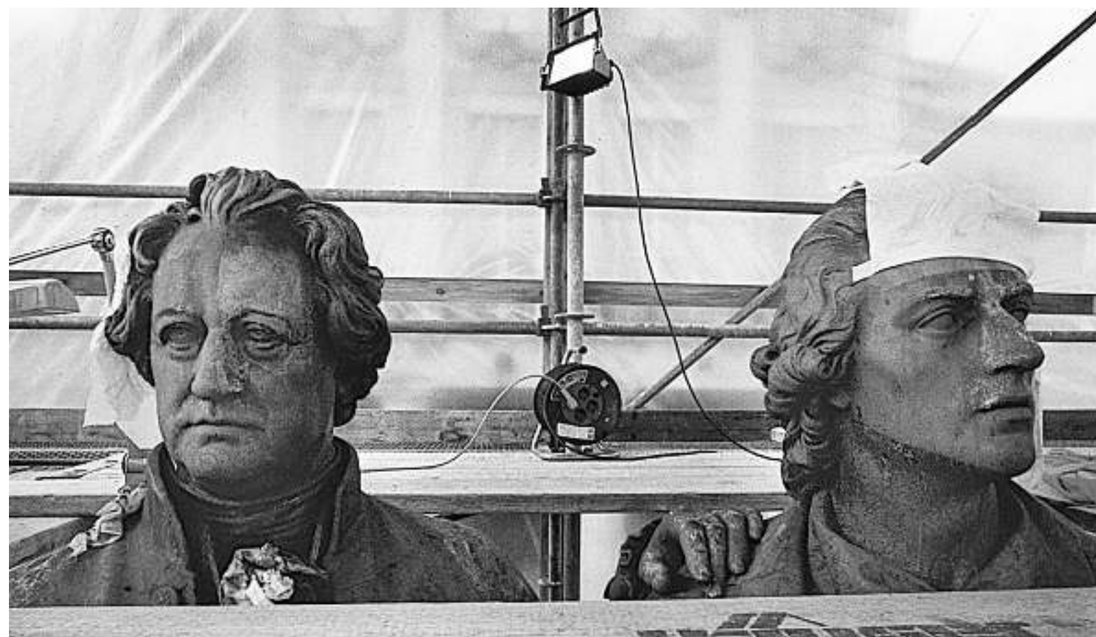
Das Goethe-Schiller-Denkmal 1991 – ein Jahr nach der deutschen Einheit.